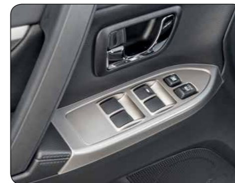
▲ Pannelli decorativi portiere Si applicano sul bordo degli interruttori alzacristalli. Effetto alluminio. Portiere anteriori. MZ313867A Portiere posteriori. MZ313868A (no ill.)