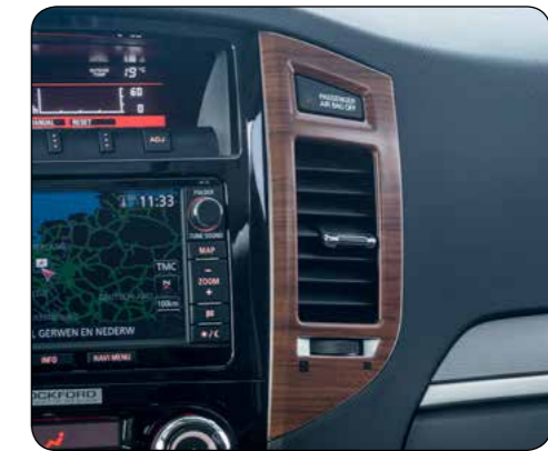
▲ Pannello centrale ventilazione Effetto legno. MZ313866W