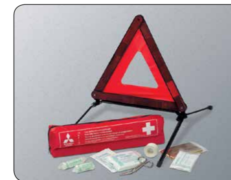
▲ Kit di sicurezza Include primo soccorso e triangolo d'emergenza. MZ312959