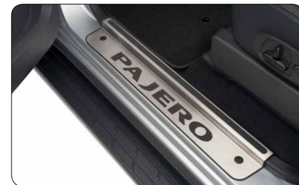
▲ Battitacco Acciaio con logo "Pajero" in materiale antiscivolo. Sostituiscono i battitacco originali. Versione 3 porte, MZ527516EX - Versione 5 porte, MZ527517EX