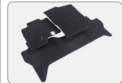
▲ Set tappetini Anteriori e posteriori, nero Velluto, versione Elegance Versione 3 porte. MZ313846 Versione 5 porte. MZ313848 Velluto, versione Comfort Versione 3 porte. MZ313845 Versione 5 porte. MZ313847