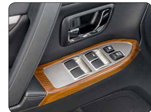
Effetto legno. Portiere anteriori. MZ313867W Portiere posteriori. MZ313868W (no ill.)