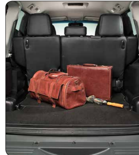
▲ Tappetino bagagliaio in tessuto Colore nero. Velluto, versione Elegance. Versione 3 porte. MZ313850 Versione 5 porte. MZ313852 Velluto, versione Comfort. Versione 3 porte MZ313849 Versione 5 porte MZ313851