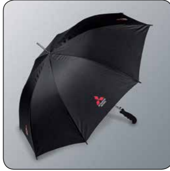
▲ Ombrello MME50196