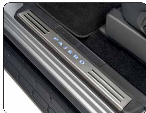
▲ Battitacco illuminati Prodotti in acciaio con logo "Pajero", anteriori illuminati. Versione 3 porte, MZ527524EX (no ill.) Versione 5 porte, MZ527518EX