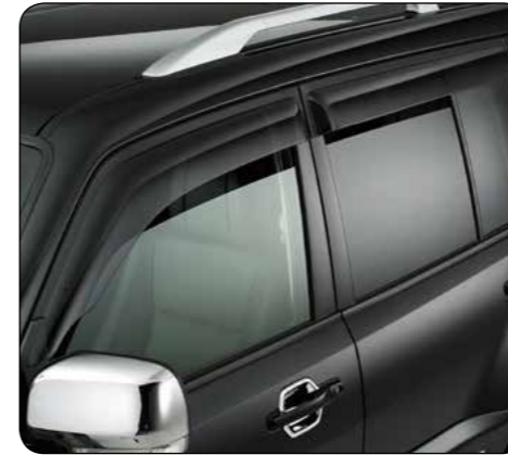
▲ Set deflettori antiturbolenza Versione 3 porte, MZ562785EX (no ill.) Versione 5 porte, MZ562786EX