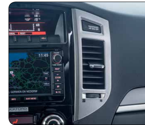
▲ Pannello centrale ventilazione Effetto metallo. MZ313866M