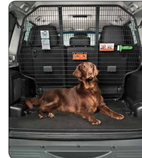
▲ Griglia di separazione In acciaio verniciata nera. Per versione 5 porte senza tettuccio. MR935379 Per versione 5 porte con tettuccio. MR935382