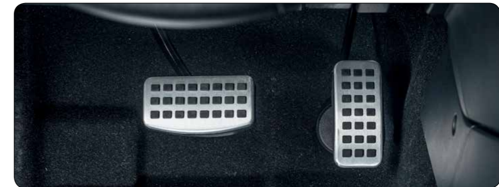
▲ Pedaliera sportiva Alluminio spazzolato. Non sono richiesti fori. Per versioni M/T. MZ313618 (no ill.) Per versioni A/T. MZ313869