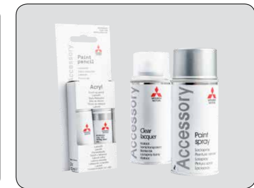
▲ Prodotti per il ritocco vernice Per maggiori informazioni consultare il sommario.