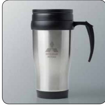
▲ Tazza MME50417

Per conoscere l'intera gamma di articoli Merchandising Mitsubishi Collection, richiedi maggiori informazioni al tuo concessionario di fiducia.