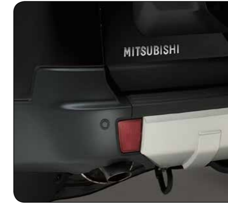
▲ Set sensori di parcheggio post. Linea "Premium". Assistenza alla retromarcia con indicazione sonora della distanza. Set di 4 pezzi (forniti verniciabili). MZ313898N